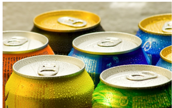
↑ Latas de aluminio para bebidas